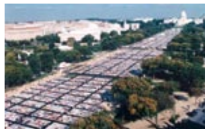
Figura 2: Aids Memorial Quilt em Washington

O saquinavir, primeiro representante de outra classe de medicamentos (os inibidores da protease) é aprovado. (Figura 2)