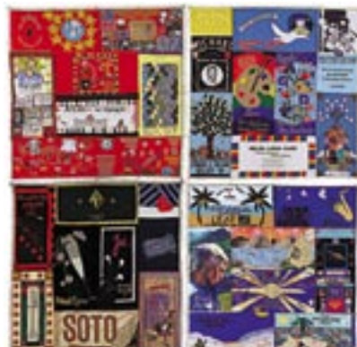
Pormenor do Aids Memorial Quilt